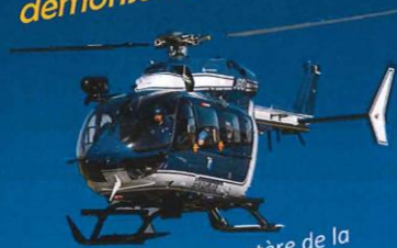
Présence de l'hélicoptère de la gendarmerie *