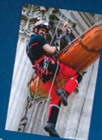
Tyrolienne avec Le GRIMP