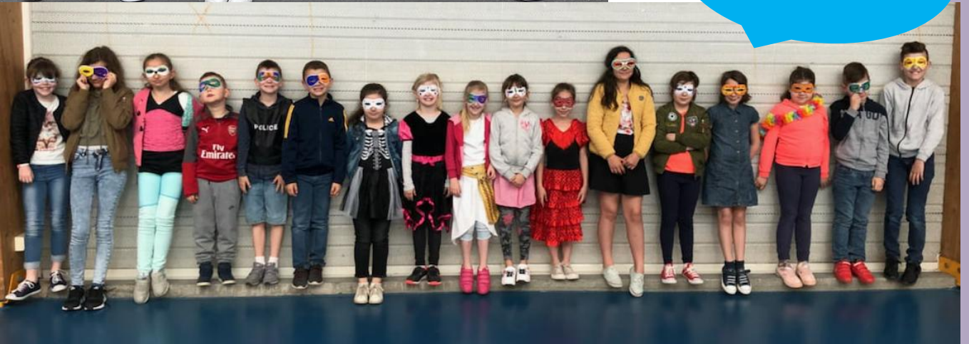
Les 8-12 ans