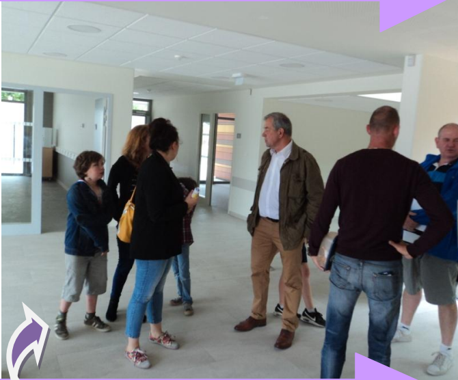
Quelques visiteurs ...