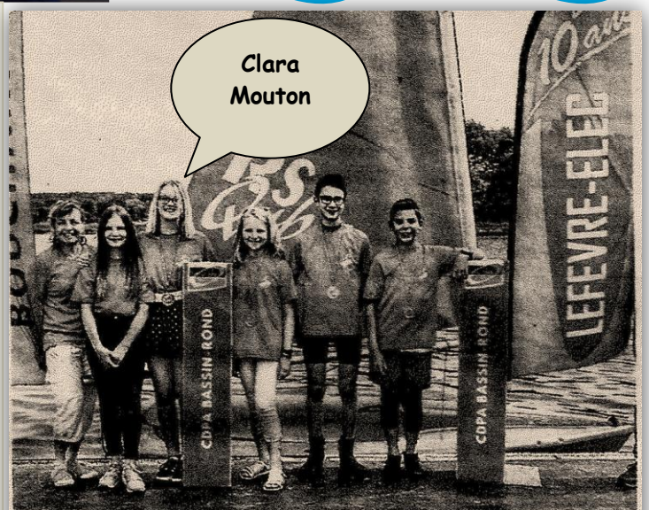
Le collège de l'Ostrevant mis à l'honneur par une médaille d'argent au championnat de France de voile UNSS.