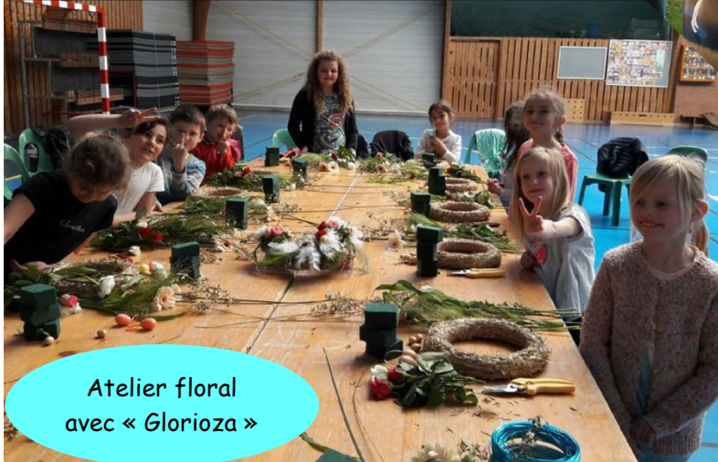
Atelier floral avec « Glorioza »