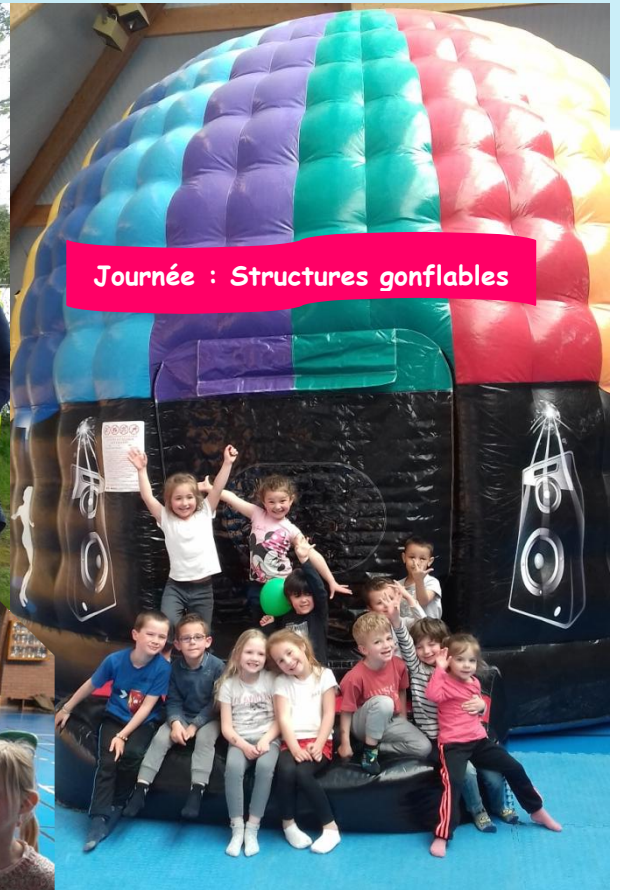
Journée : Structures gonflables