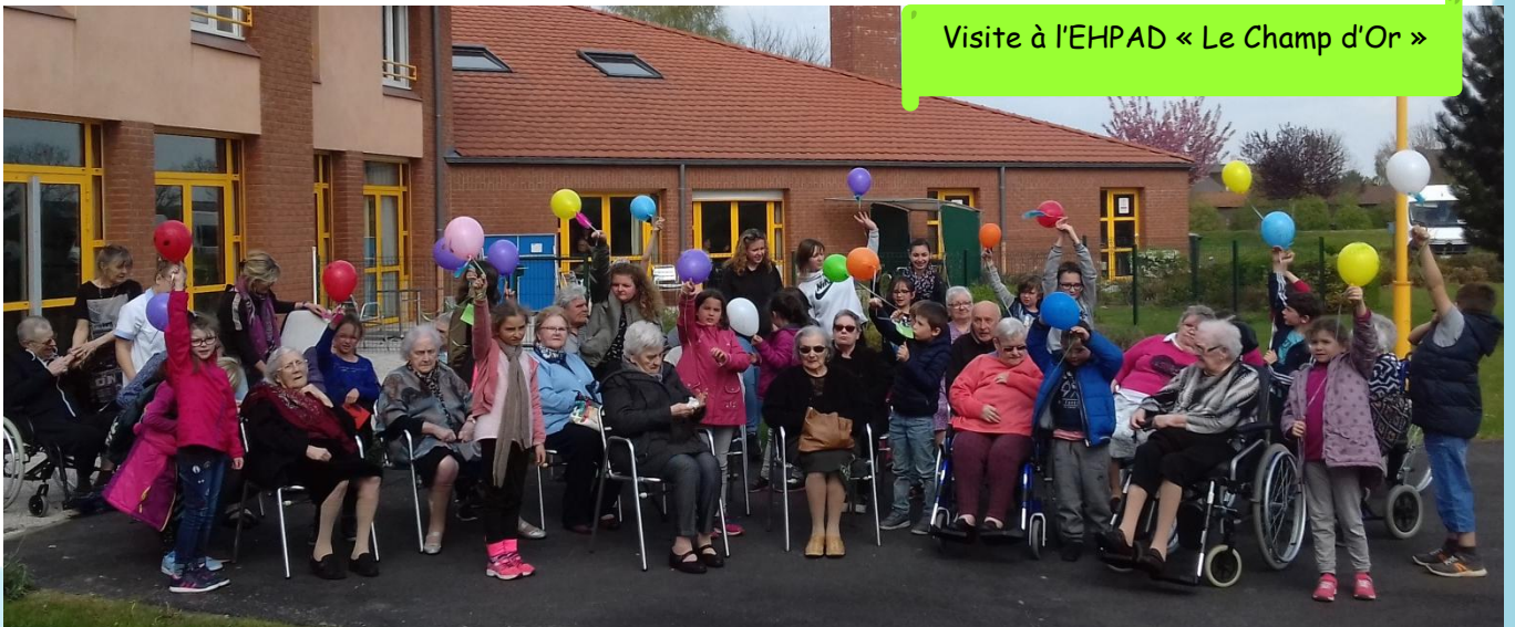
Visite à l'EHPAD « Le Champ d'Or »