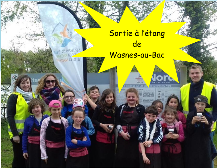
Sortie à l'étang de Wasnes-au-Bac