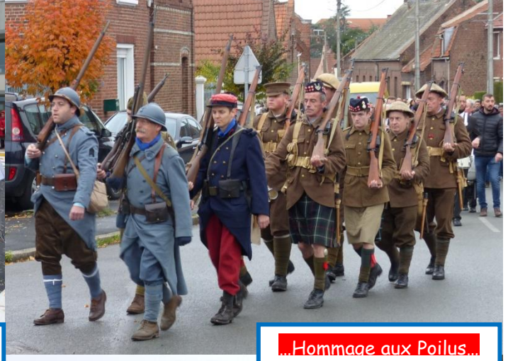
...Hommage aux Poilus...