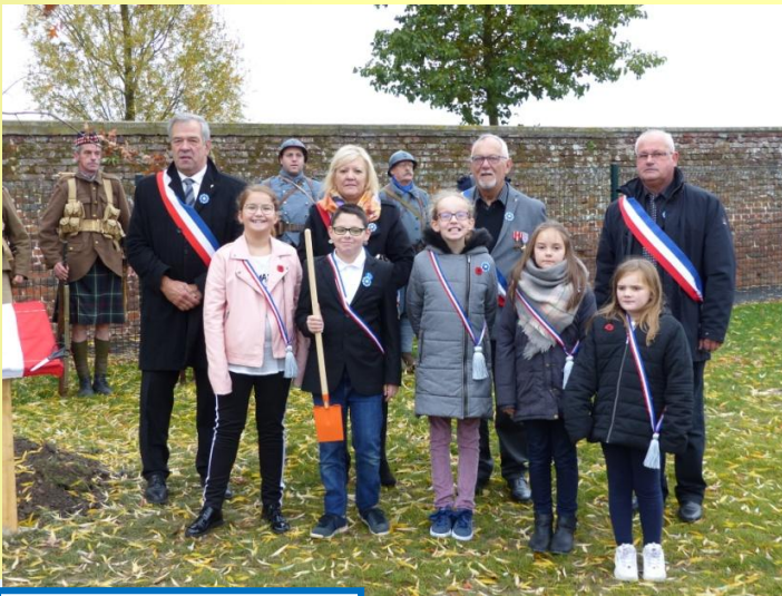
...Chant des enfants...