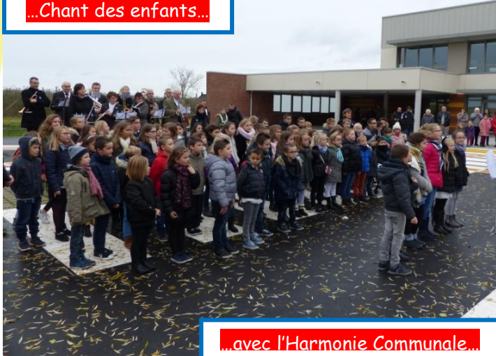
...avec l'Harmonie Communale...