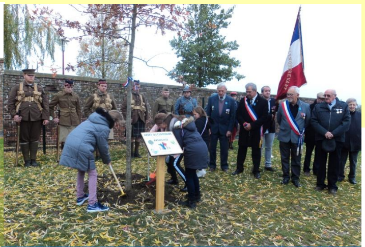
Plantation de l'arbre du Centenaire...