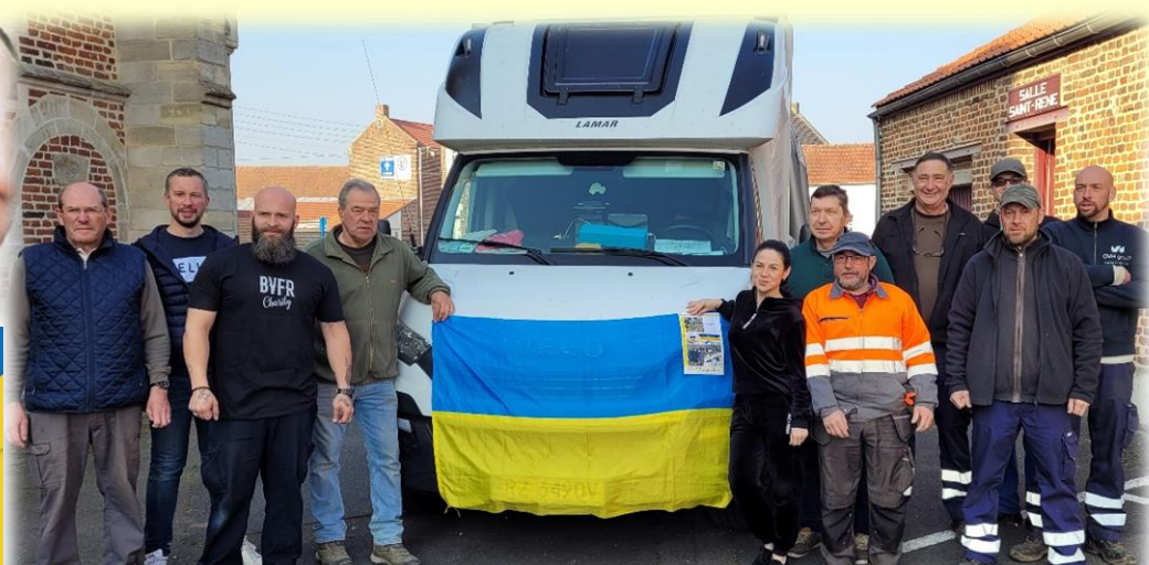
Départ des dons vers RZESZOW, ville au sud de la Pologne