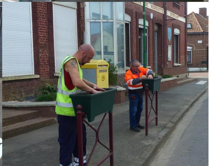
Les travaux de printemps nécessitent une préparation pour les plantations florales à venir