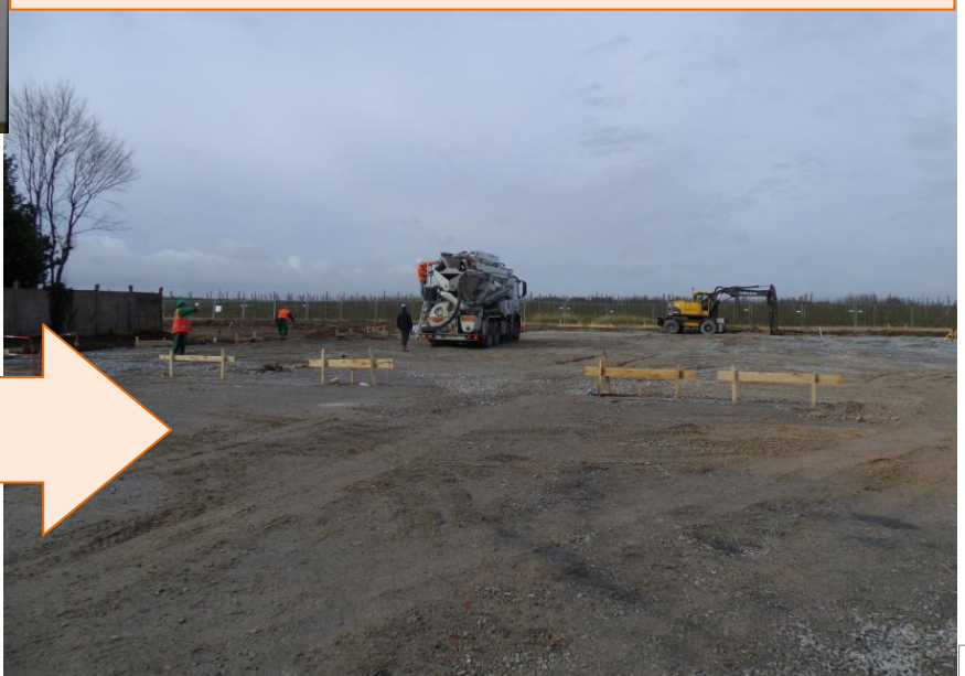
Vue d'ensemble après démolition du terrain d'implantation du groupe scolaire