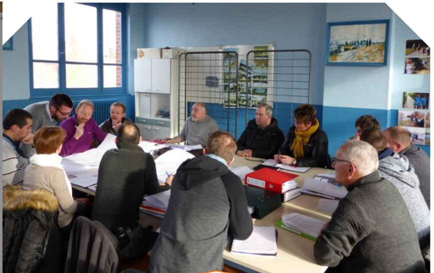
Chaque vendredi matin, une réunion de suivi de chantier est organisée entre la Municipalité et les entreprises sous contrôle du maître d'œuvre