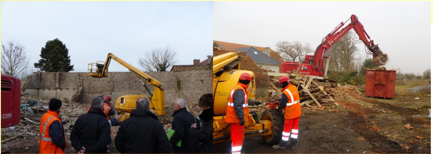
Démolition des anciens bâtiments de la parcelle du futur groupe scolaire