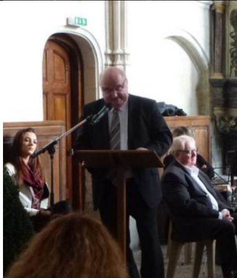
Monsieur Alain Bocquet, Président de la Communauté d'Agglomération de la Porte du Hainaut