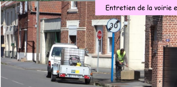
Entretien de la voirie et des espaces verts