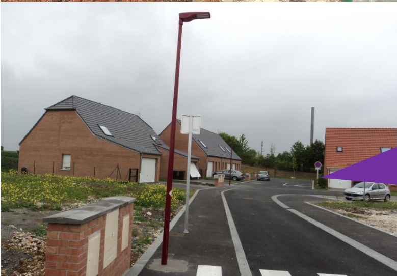
Extension du Domaine des Bûchons : Bienvenue aux nouveaux résidents des 5 logements locatifs attribués en Mai.