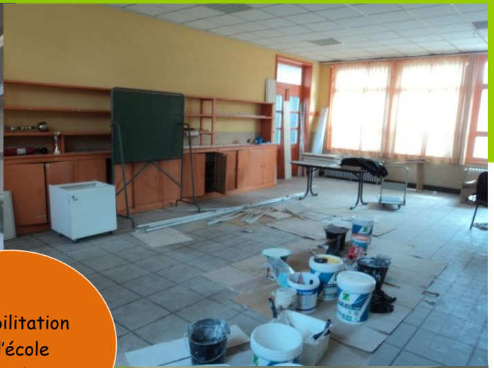
Réhabilitation de l'école primaire