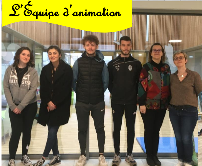
« Village en sport » Par le Département du Nord