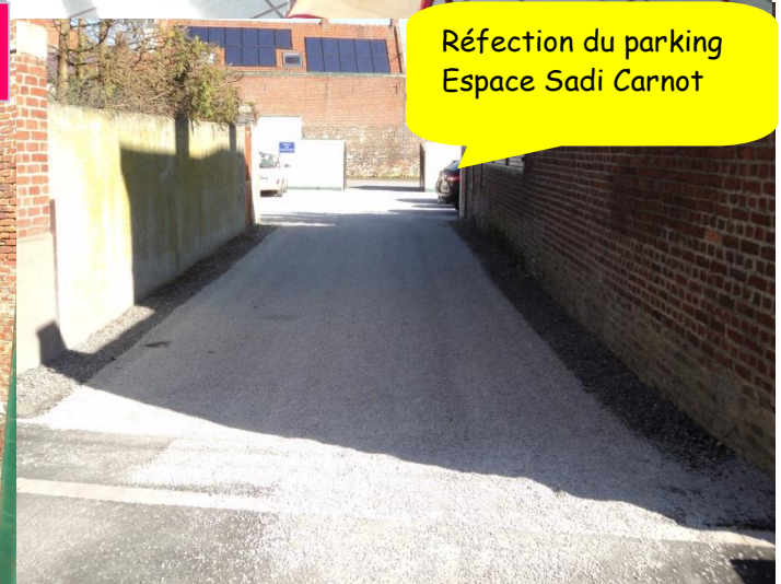
Réfection du parking Espace Sadi Carnot