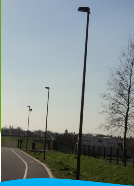
Pose de candélabres au parking du Groupe Scolaire