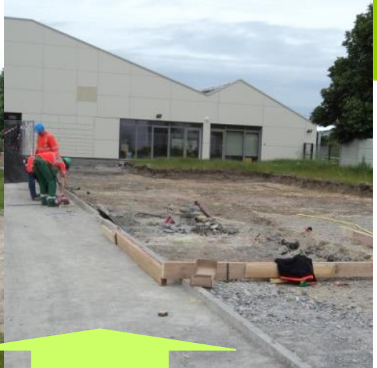
Dépavage à l'entrée du Groupe Scolaire, début des fondations du restaurant, prévision fin de travaux mi novembre